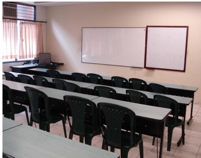
Tabla 14. Lista de Aulas de clase y laboratorios